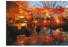
紅葉のライトアップ 佐藤美栄子/大磯城山公園