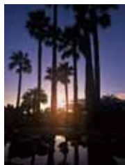
夕焼け 金山 利幸/ 辻堂海浜公園