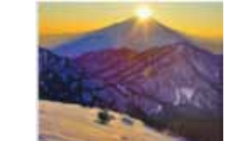
沈むダイヤモンド富士 白井源三/丹沢 蛭ヶ岳