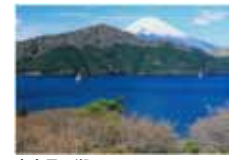
富士見の湖 海老根智/恩賜箱根公園