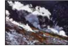
光射す谷 上野祐司/大涌谷