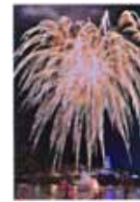
湖上の火花 田村泰規/津久井湖城山公園