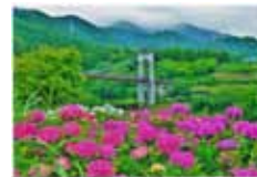
梅雨を彩る 間瀬幾雄/秦野戸川公園