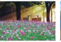
光芒とコスモス 今井敏夫/相模原公園