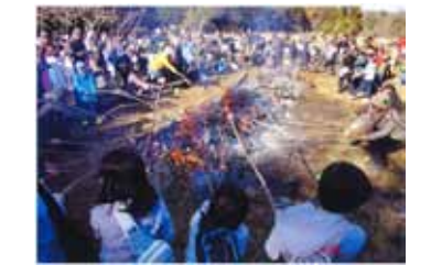
楽しいどんと焼き 石井清一/茅ヶ崎里山公園

評 昔懐かしい「どんと焼き」は、色とりどりの餅を焼いて食べるのが楽しみの一つですが、その様子を過不足なくとらえています。作者はかなりのベテランのようで、広角レンズの使い方が実に巧み。広い画角を生かす撮影位置が絶妙で、どんと焼きの状況が一目でわかります。また、手前の三人の子供達の後ろ姿がこの行事の主役を教えてくださいます。