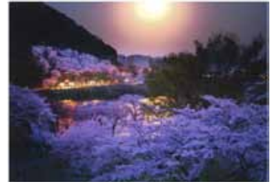
桜花月照 細井健司/津久井湖城山公園

評 満開の桜、最高の舞台を的確にとらえたテクニックというより「写真眼」が冴えています。桜が明るくきれいに見える日中ではなく、満月の夜というタイミングがこの作品のすべてです。夜は、煩雑に見える人工物が写りにくく桜が強調されますが、それよりも、桜には月の光がよく似合うと言いたくなる夜の空気感がしっかりと写っています。