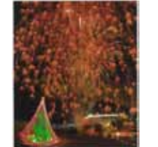
ジャンボツリーの華 根本紀男/宮ヶ瀬湖畔