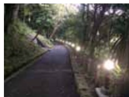
夕方の灯し火 加藤 凌大/大磯城山公園