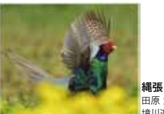
縄張り宣言 田原武児/境川遊水地公園