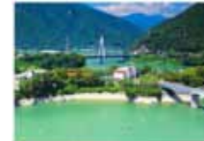
丹沢湖の夏 増田功二/丹沢湖