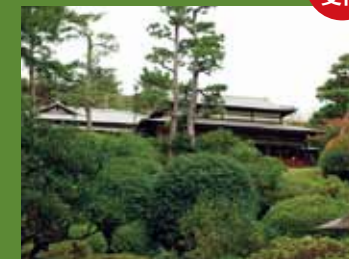
旧陸奥宗光邸 邸園