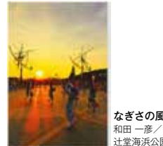
なぎさの風 和田一彦/辻堂海浜公園