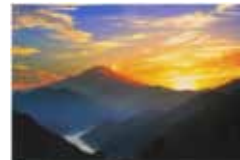
丹沢湖の夕暮れ 齋藤敏雄/山北町玄倉丹沢山系